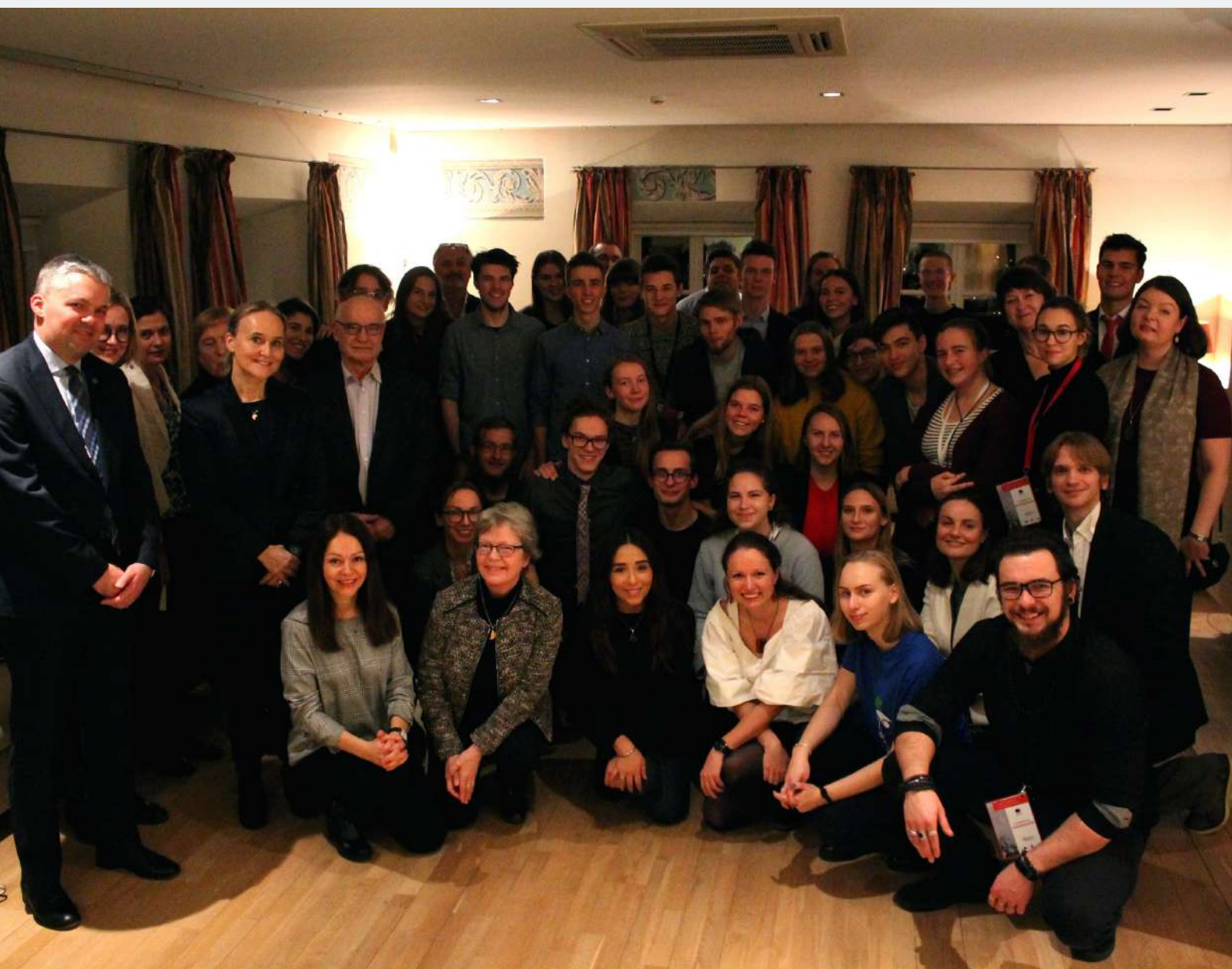
Nuotrauka iš renginio Youth Superpower: Defending Democracy Nyderlandų Karalystės Rezidencija